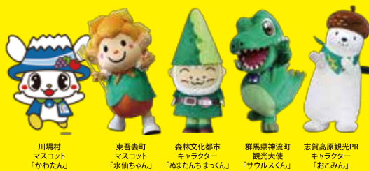
川場村 マスコット 「かわたん」

■お問い合わせ先:ぐんま山フェスタ実行委員会事務局(株式会社総合PR内) TEL.027-253-8378