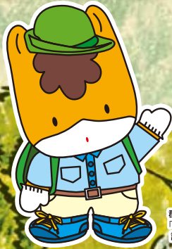
群馬県のマスコット 「ぐんまちゃん」 許諾第30-100086号