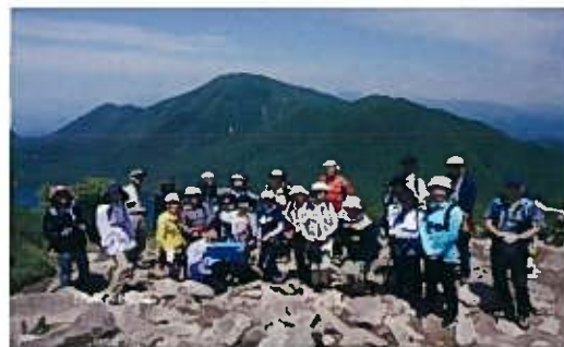
地蔵岳山頂から最高峰黒檜山を望む