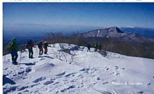
長七郎山稜線を行く(正面は荒山・浅間山)