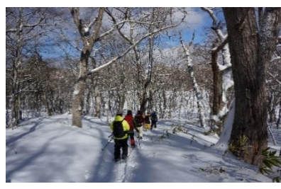
ミズナラとダケカンバの林を歩く