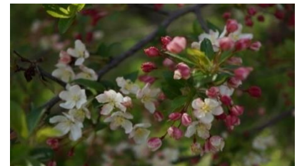
覚満淵の周囲に広がるズミ(酸実)