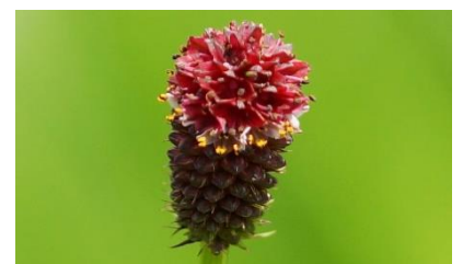
吾亦紅の花は上から下へ咲きます