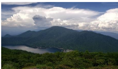
地蔵岳1674mから黒檜山1828m