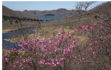
籠山のアカヤシオ