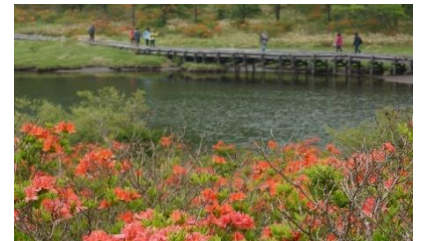
覚満淵のレンゲツツジ群落