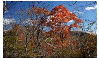
オオイタヤマメイツの紅葉