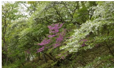
小沼火山火口壁の大群落