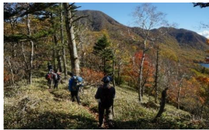
主峰黒檜山1828m・大沼の眺望