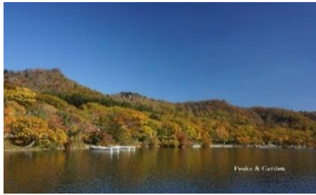
出張山・薬師岳1528m・陣笠山の稜線を歩く

【申込み締切日】10月20日(水) 先着30名 1日目 8:45～ 受付(青木旅館集合 最寄バス停湖尻厚生団地入口) 9:00～ 青木旅館＝厚生団地＝出張峠＝出張山＝野坂峠＝ 14:00 薬師岳＝陣笠山＝厚生団地＝青木旅館 2日目 9:45～ 受付(赤城公園ビジターセンター:VC集合) 10:00～ 覚満淵自然観察会(実:ミズナラ・ズミ・カトウマコミ・メイ・コフシetc.) 15:00 VCにて講義(秋冬の山歩き コース紹介 秋冬の装備etc.)