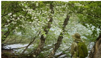
小沼湖畔のシロヤシオ