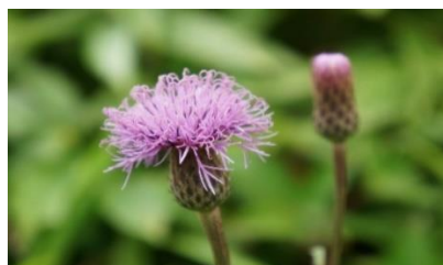
薊に似ているが全く棘の無いタムラソウ