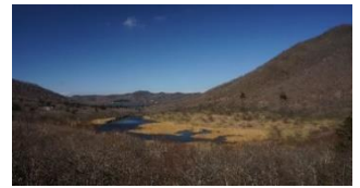
鳥居峠から覚満淵