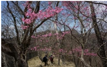
横引尾根のアカヤシオ